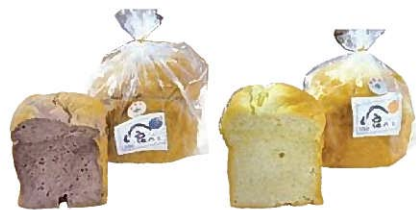
食パン(ブルーベリー入り、ゆず入り)