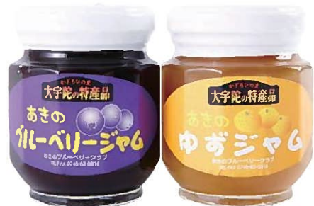
ブルーベリージャム、ゆずジャム

栽培期間中より化学合成農薬を一切使わず、平成13年より同じ製法でつくり、品質も一定でこだわりの味を実現させています。