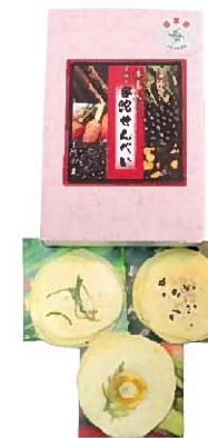
宇陀せんべい本葛入り (3枚入り×6袋/小箱)