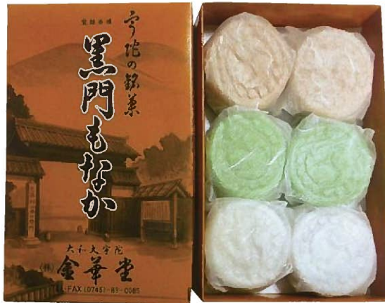
宇陀名物 黒門もなか

地元産の小豆あん、トロス豆のこしあんで作った柚子と抹茶あんの3種類のおいしさを楽しんでいただけます。どれも優しい甘さで、“ホッ”と安らぐひと時に最適です。