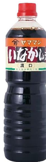
いなかしょうゆ (濃口)

大正7年、山紫水明の地・菟田野に創業した私たちは、菟田野の気候風土に育まれた醤油をつくっています。長年培った技によってつくられた醤油を基に、様々な醤油加工品も開発・製造し、多くの食卓のおいしさを引き立てています。