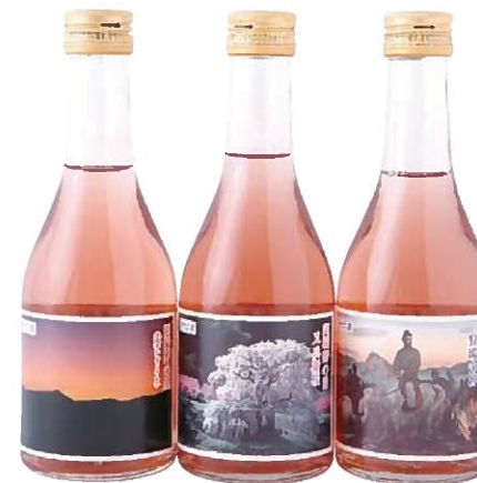
赤米酒 阿騎野物語300ml

古代より「阿騎野」と呼ばれた大宇陀の地で、古代の赤米を用いて醸造した万葉のロマン香る日本酒です。