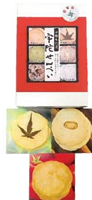
宇陀せんべい6種入り (3枚入り×6袋/袋、小箱)

宇陀せんべいは1枚1枚を手焼きしているため、それぞれの顔を持ちます。心を込めて焼き上げた素朴でかわいいおせんべいです。