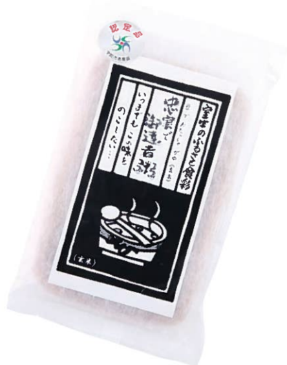
忠実で御達者粥(豆でおたっしやがゆ)

ヘルシーな健康食品としてだけでなく、常温での長期保存も可能なので非常食としてもご利用いただけます。