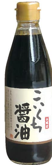
本醸造こいくち醤油

約130年の歴史があり、製造から販売までを一貫して行っており、昔ながらの製法と味を守り続けています。