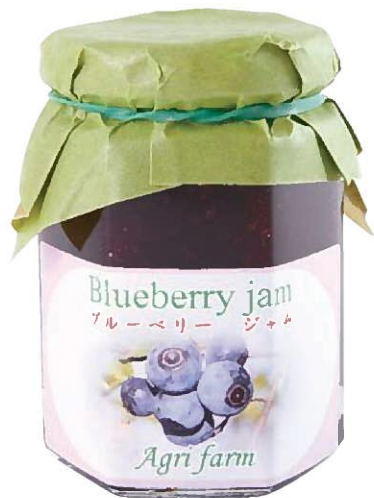
アグリファーム農園 ブルーベリージャム

長年育ててきたブルーベリーがジャムになりました！宇陀市のアグリファーム農園で採れたブルーベリーを100%使用した、濃厚で深い味わいを楽しめるジャムをお届けします！