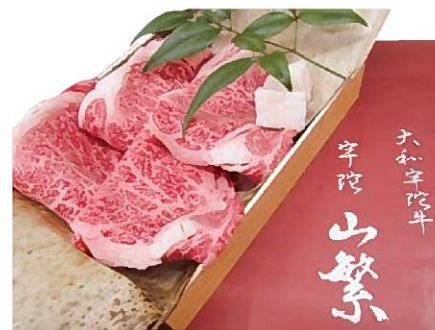
宇陀牛(特選ロスすき焼き用)