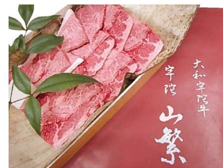
宇陀牛(特上焼肉用)