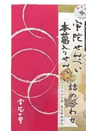
宇陀せんべい詰め合わせ (3枚入り×10袋/大箱)